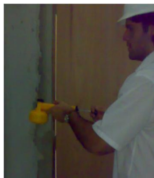
FIGURA 2 – Detalhe dos blocos utilizados na alvenaria e do processo de pulverização em campo.