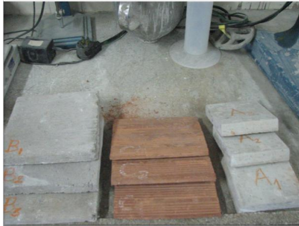
Figura 2 - Detalhe das diferentes bases utilizadas para o estudo.