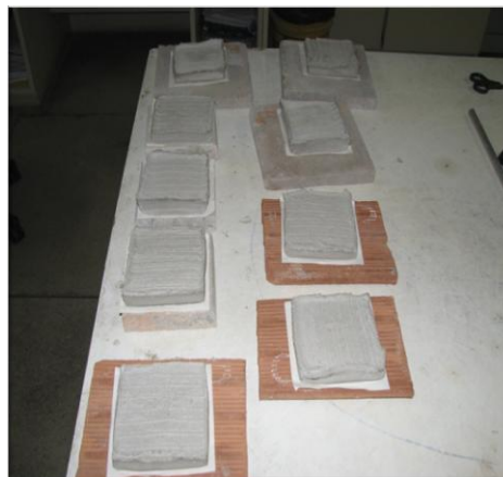
Figura 4 - Aspecto das amostras imediatamente antes da pesagem final.