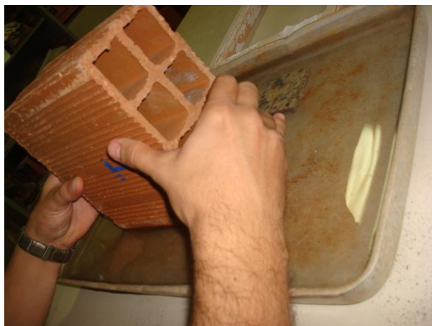
Figura 1 – Imagem dos blocos cerâmicos ensaiados quanto à absorção de água inicial.