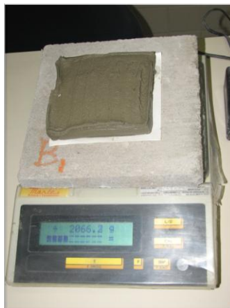
Figura 5 - Pesagem da amostras do conjunto, logo após a colocação da argamassa.